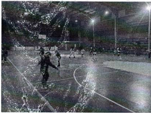
Registro fotográfico taller Patinaje Artístico 20-05-2026