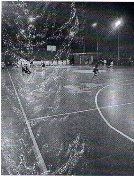
Registro fotográfico taller Patinaje Artístico 13-05-2026