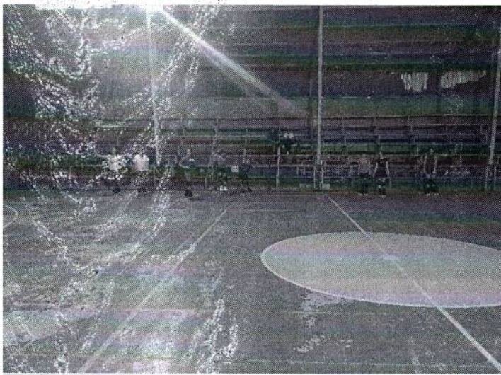
Registro fotográfico taller Patinaje Artístico 15-05-2026