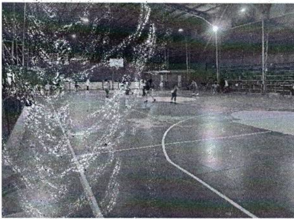
Registro fotográfico taller Patinaje Artístico 22-05-2026