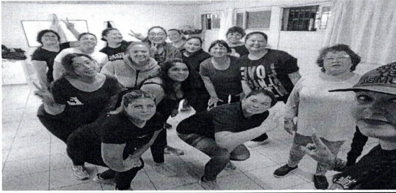
Registro fotográfico taller villa chiloé