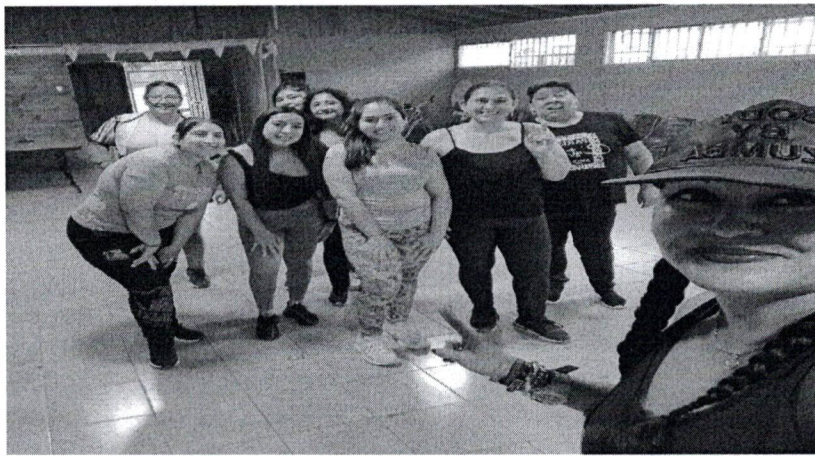
Registro fotográfico taller villa las orquídeas