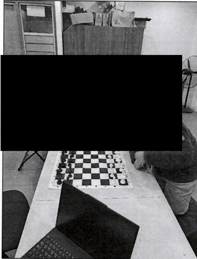
Imagen 2: Patrones de mate en uno (memorización)