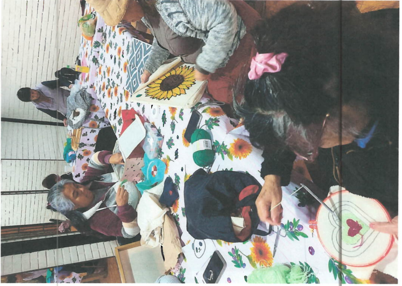
Taller "Segunda Tránsvergal 101, Villa Los Jazmines"