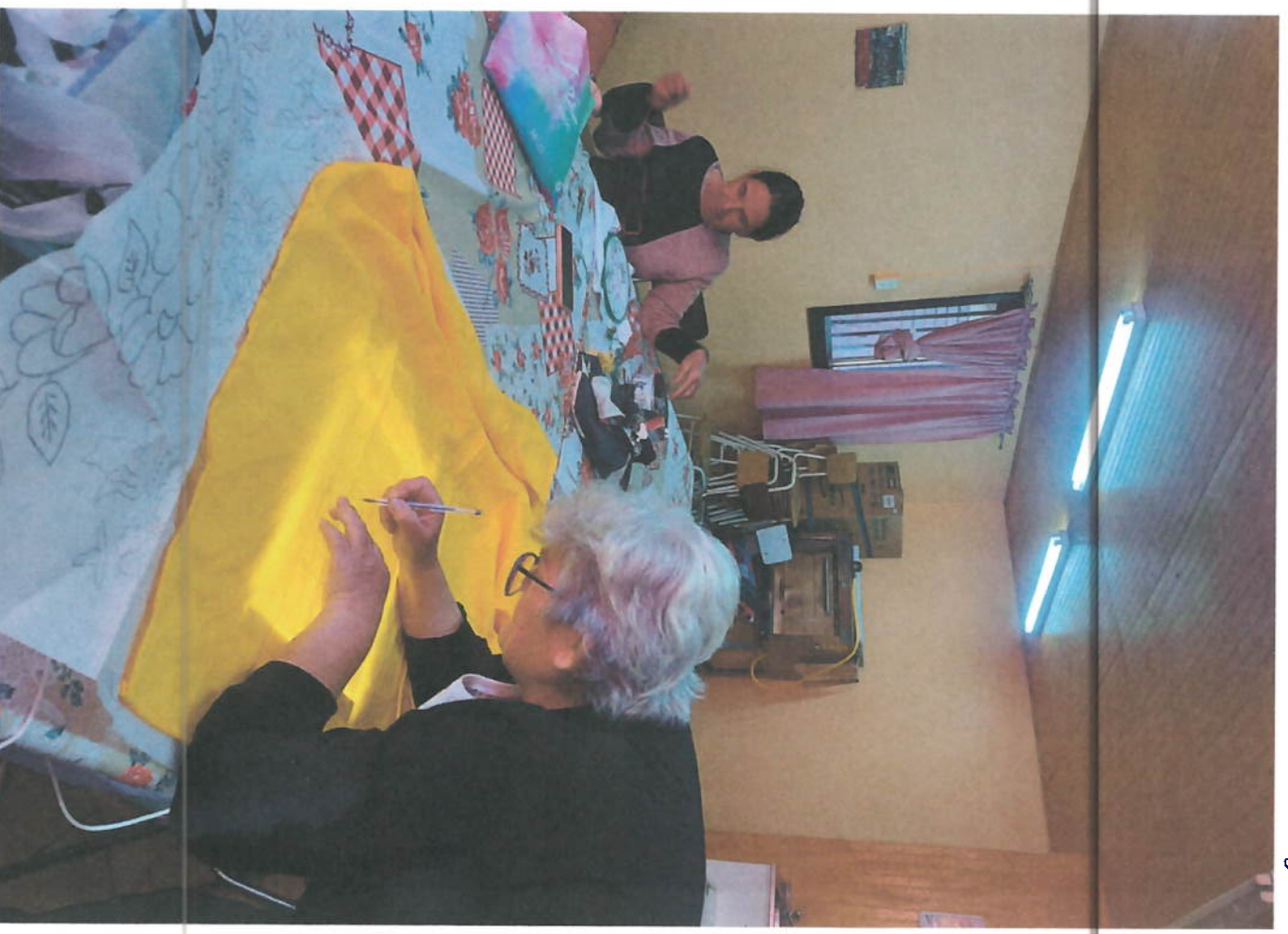
Taller "María Luisa Bombal, Villa Las Tinajas"