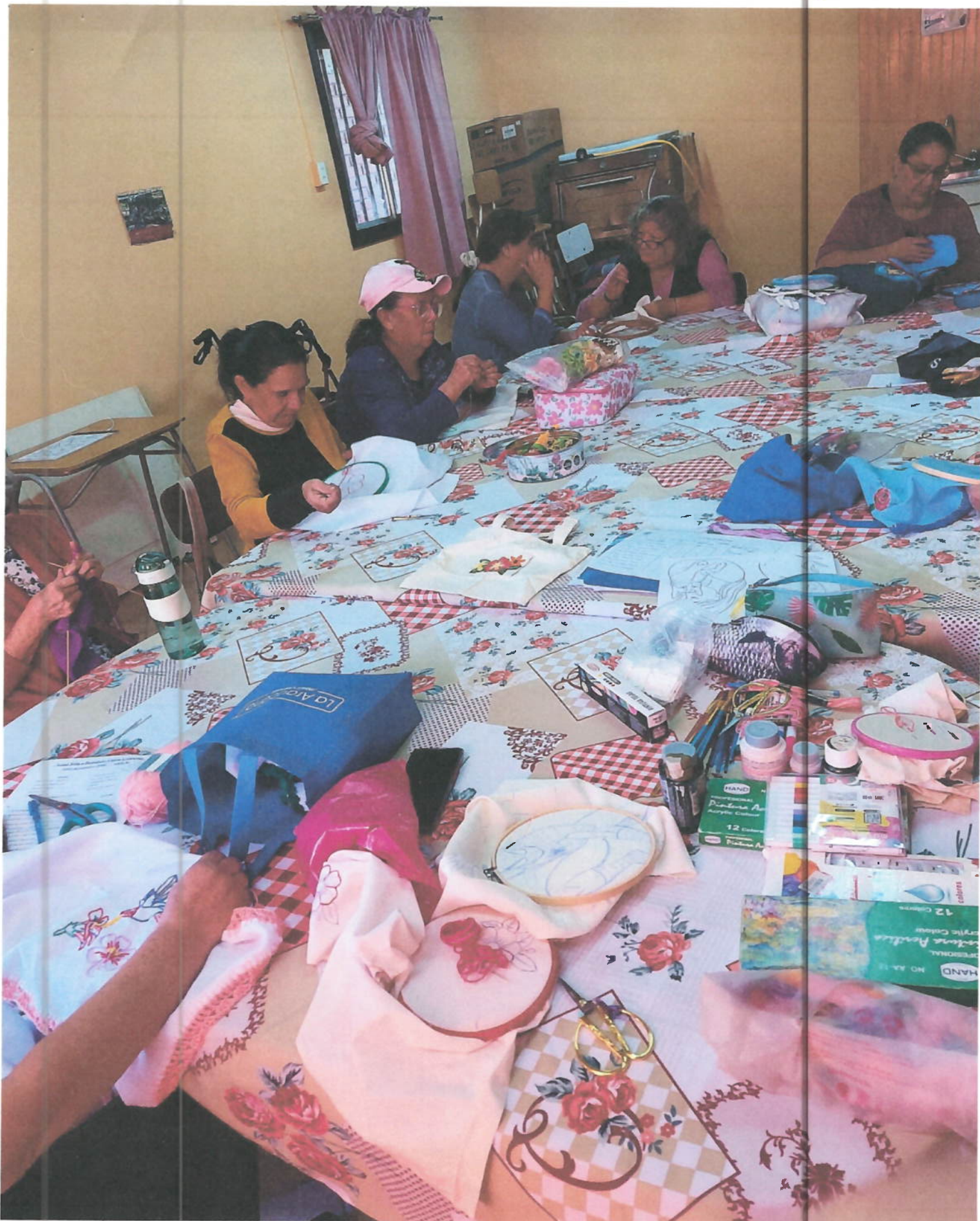
Taller "María Luisa Bombal 10 88, Villa los Teros"