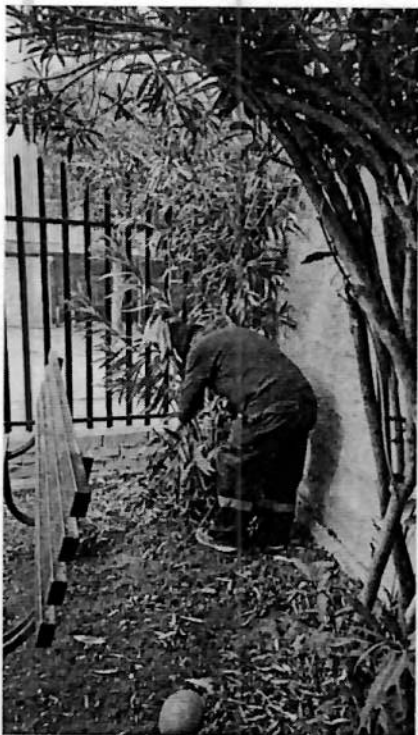
Plantación en sede social los silos en conjunto de los vecinos