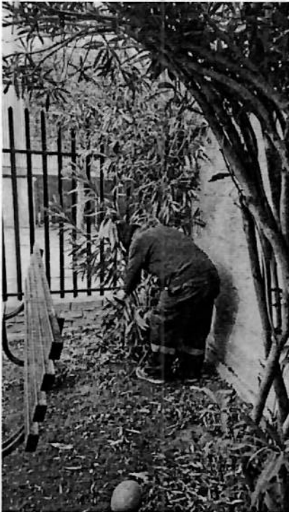
Plantación en sede social los silos en conjunto de los vecinos