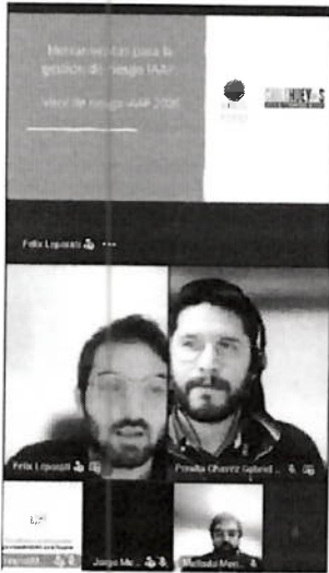
Charla Influenza aviar