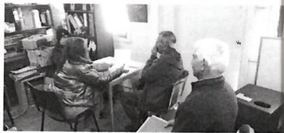
Atención usuarios Regularización Derechos de Aprovechamiento de Agua