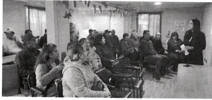
Charla con OLN