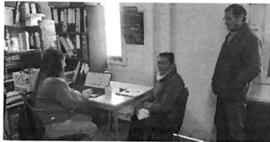
Registro de subsistencia