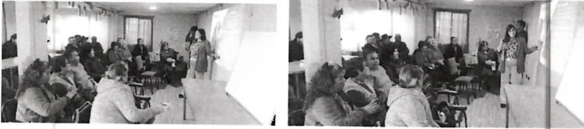
Charla Regímenes tributarios