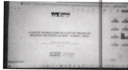
Reunión Rendiciones en Sisrec