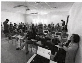
Mesa Agroclimática provincial