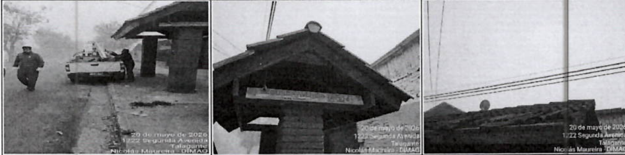
20 de mayo de 2026 1222 Segunda Avenida Talagante