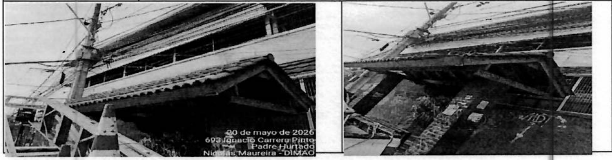
30 de mayo de 2026 693 Ignacio Carrera Pinto Padre Hurtado Nicolás Maureira - DIMAQ