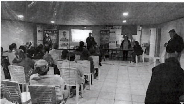
Figura 3: Presentación comunitaria realizada junto a dirigente social de Villa Esperanza III y el programa Crecer en Comunidad, instancia donde se informó a la comunidad sobre las propuestas de intervención elaboradas por niños, niñas y adolescentes para el mejoramiento y recuperación de los espacios públicos del sector.