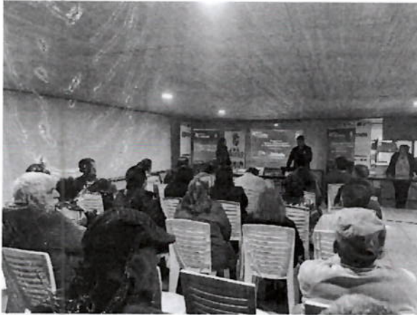
Figura 2: Presentación comunitaria de los resultados obtenidos durante el recorrido barrial realizado junto a niños, niñas y adolescentes de Villa Esperanza III, donde se dieron a conocer las principales problemáticas detectadas y las propuestas de intervención para el mejoramiento de áreas verdes y elaboración de mural comunitario.