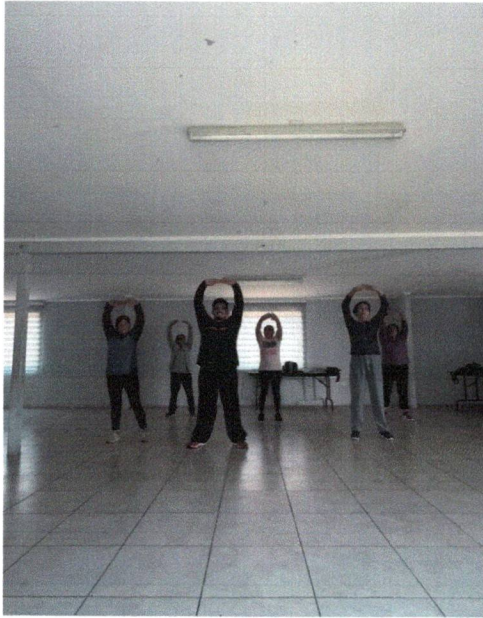
Sede La Voz de Arauco