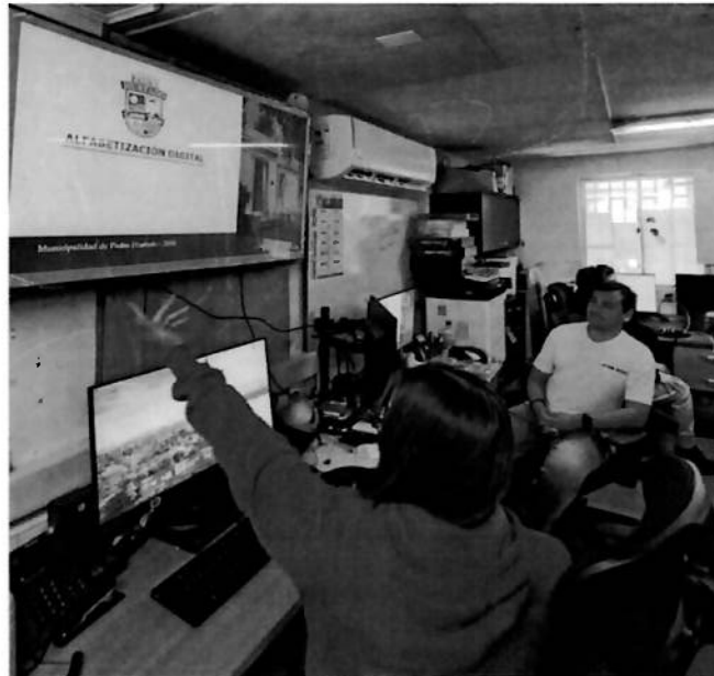
Ilustración 1: Reunión sostenido con equipo interno

Coordinación de la distribución de tareas a los profesionales del programa, según las indicaciones del encargado. Asimismo, recepción y gestión de llamados telefónicos a través de la red de la oficina, con el fin de coordinar acciones con el equipo.