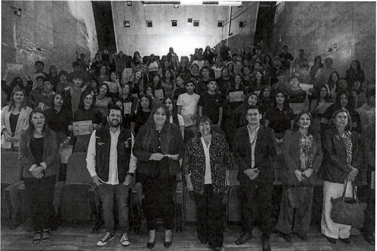
-Entrega de Viviendas Sociales.