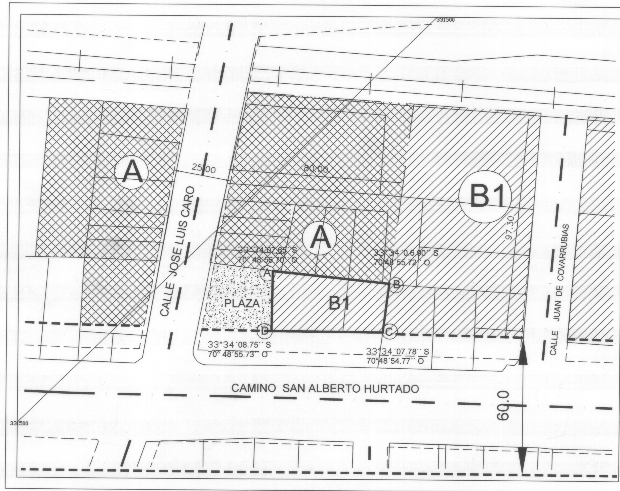
SITUACION QUE SE APRUEBA