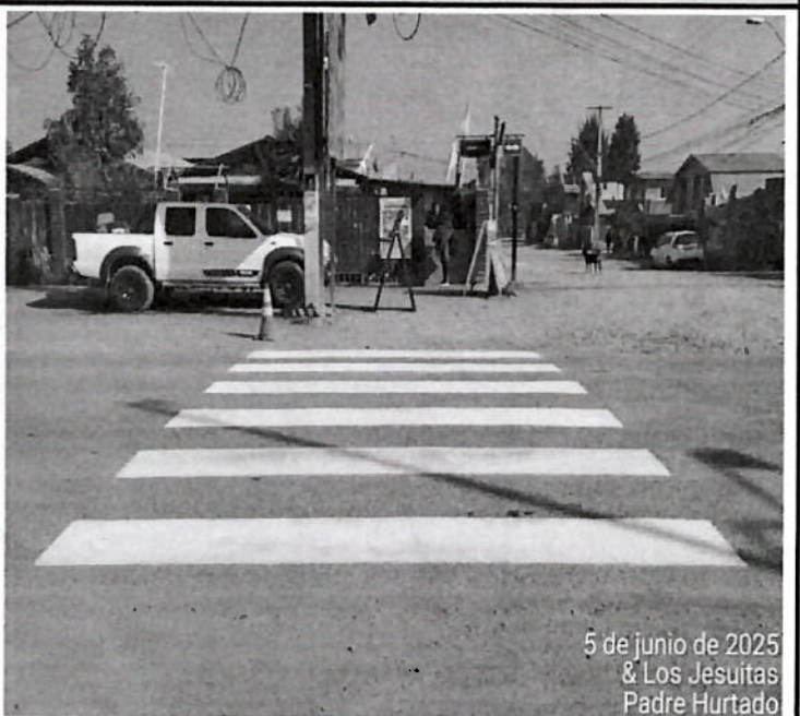
5 de junio de 2025 & Los Jesuitas Padre Hurtado