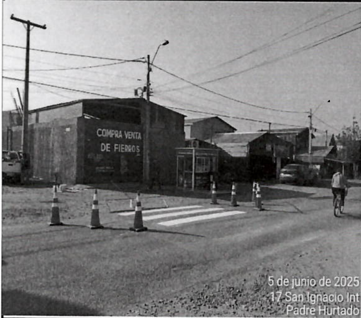
5 de junio de 2025 17 San Ignacio Int Padre Hurtado