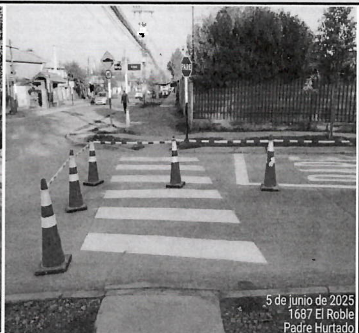
5 de junio de 2025 1687 El Roble Padre Hurtado