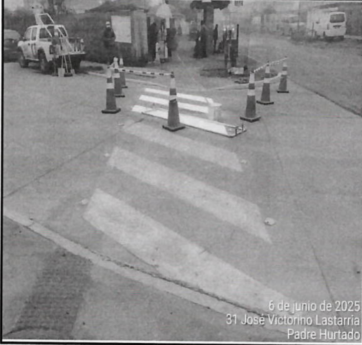
6 de junio de 2025 31 José Victorino Lastarria Padre Hurtado