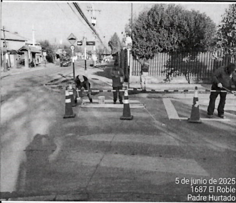
5 de junio de 2025 1687 El Roble Padre Hurtado