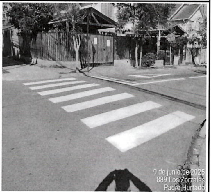
9 de junio de 2025 889 Los Zorzales Padre Hurtado