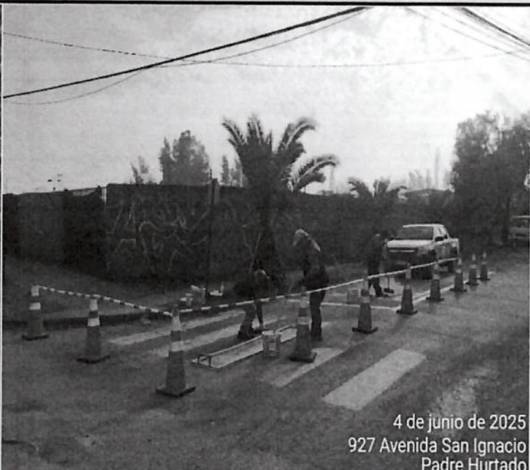
4 de junio de 2025 927 Avenida San Ignacio Padre Hurtado