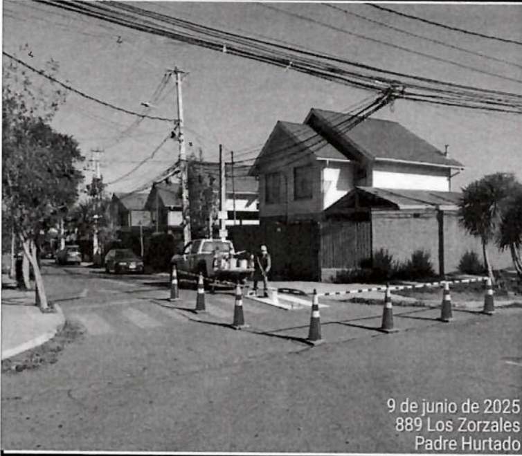
9 de junio de 2025 889 Los Zorzales Padre Hurtado