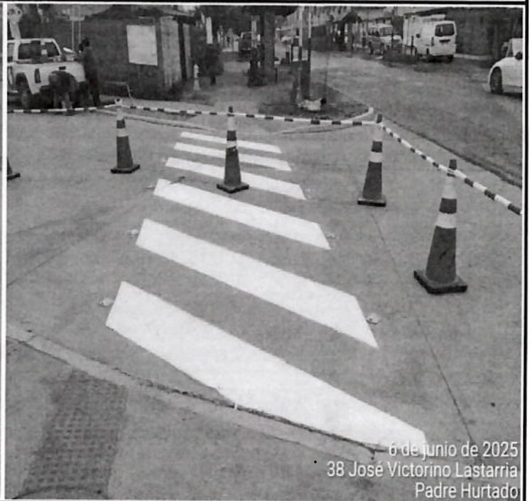
6 de junio de 2025 38 José Victorino Lastarria Padre Hurtado