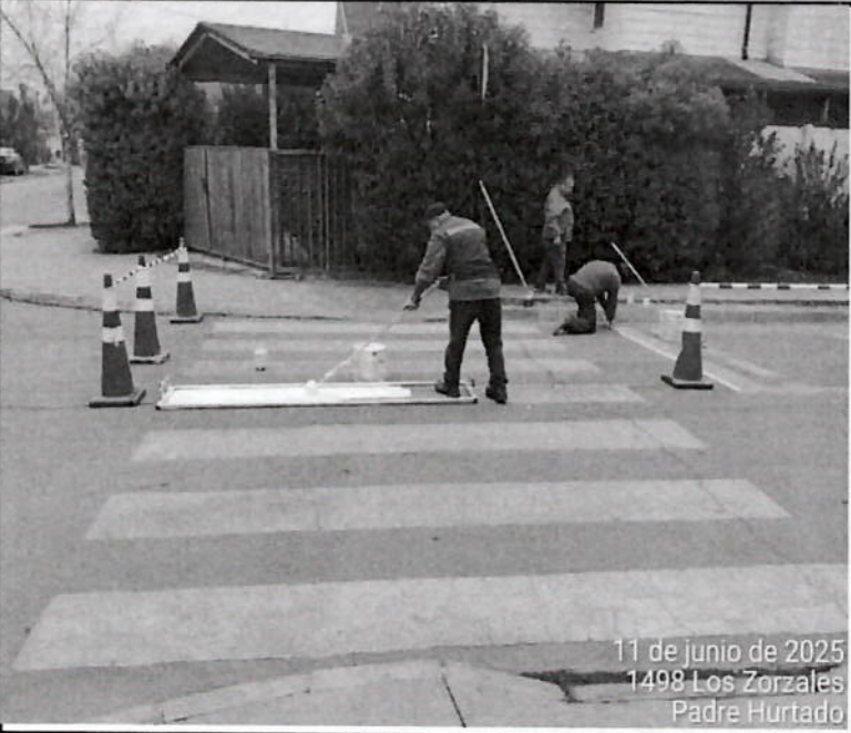
11 de junio de 2025 1498 Los Zorzales Padre Hurtado