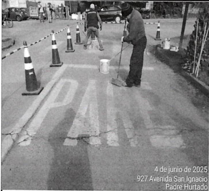
4 de junio de 2025 927 Avenida San Ignacio Padre Hurtado