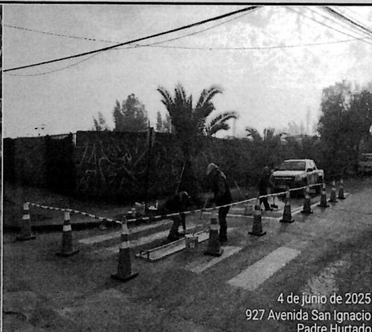
4 de junio de 2025 927 Avenida San Ignacio Padre Hurtado