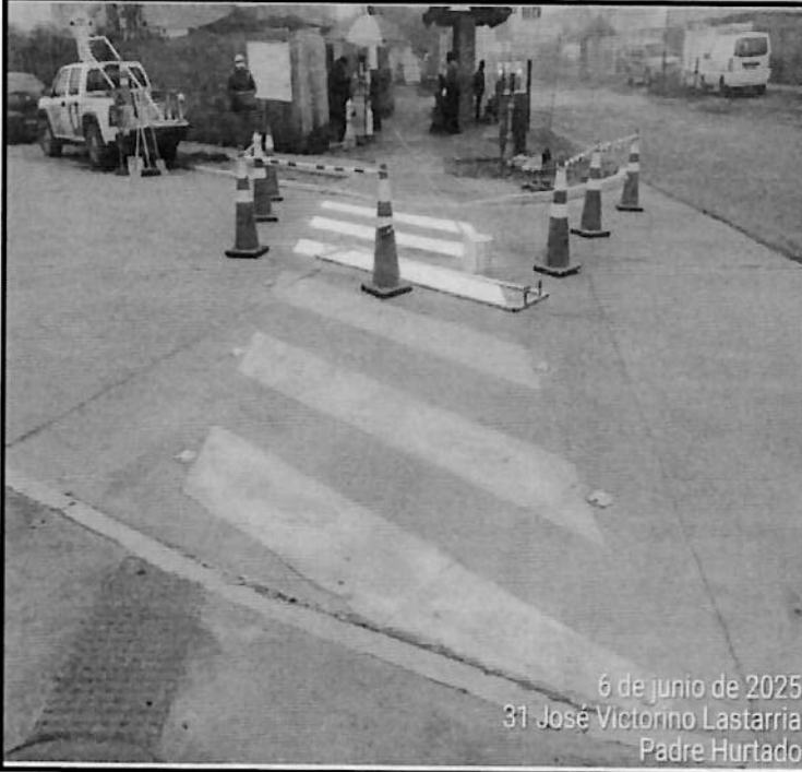
6 de junio de 2025 31 José Victorino Lastarria Padre Hurtado