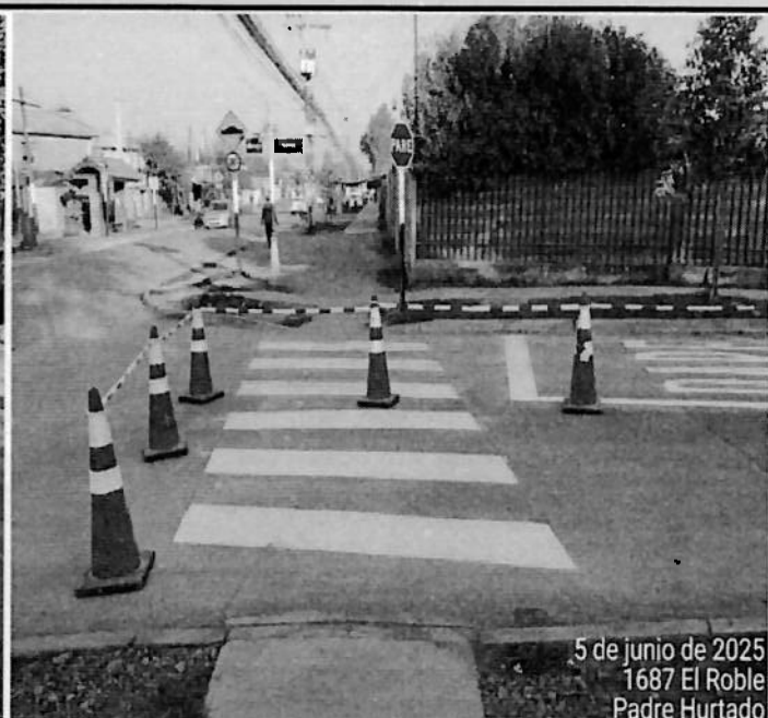
5 de junio de 2025 1687 El Roble Padre Hurtado