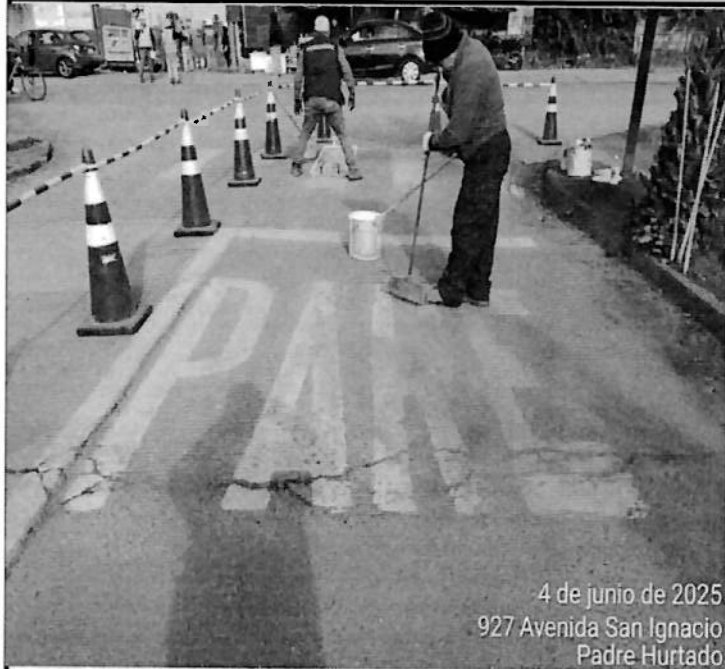
4 de junio de 2025 927 Avenida San Ignacio Padre Hurtado