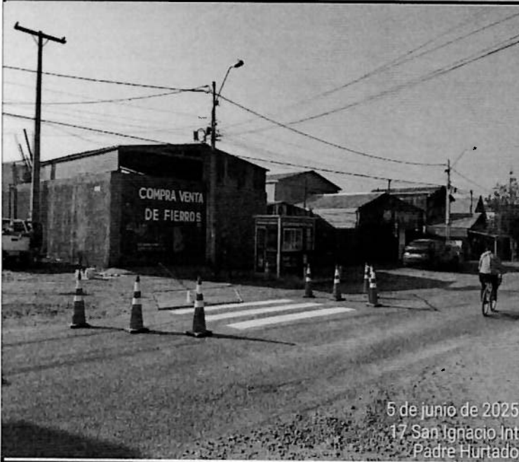
5 de junio de 2025 17 San Ignacio Int Padre Hurtado