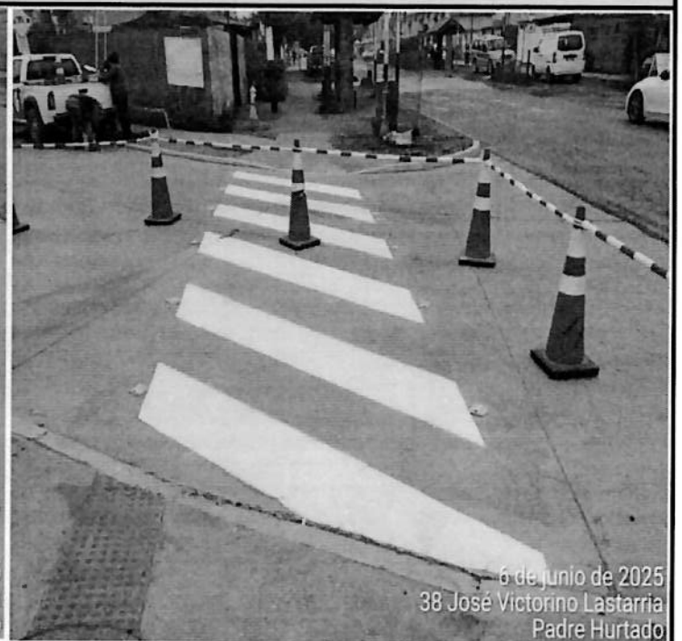
6 de junio de 2025 38 José Victorino Lastarria Padre Hurtado