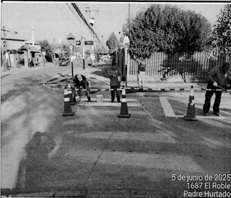
5 de junio de 2025 1687 El Roble Padre Hurtado