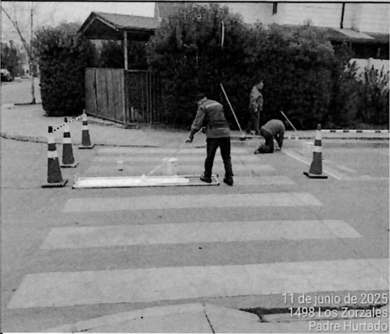
11 de junio de 2025 1498 Los Zorzales Padre Hurtado