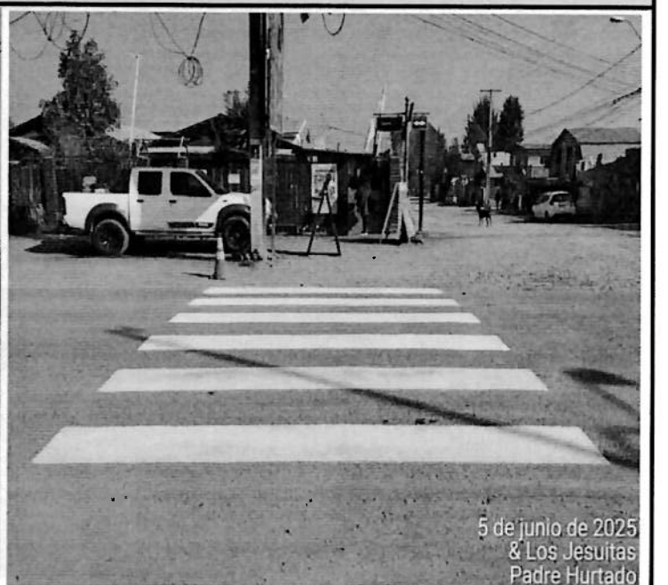
5 de junio de 2025 & Los Jesuitas Padre Hurtado