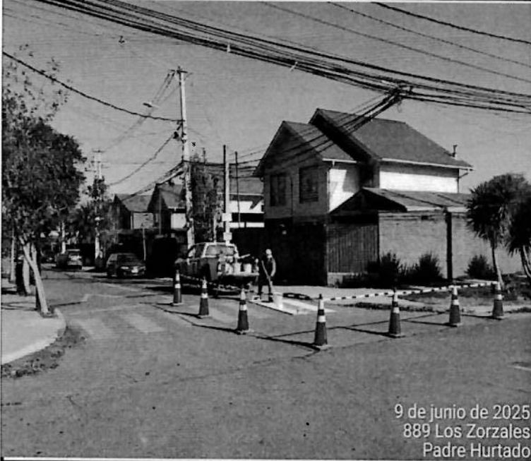
9 de junio de 2025 889 Los Zorzales Padre Hurtado