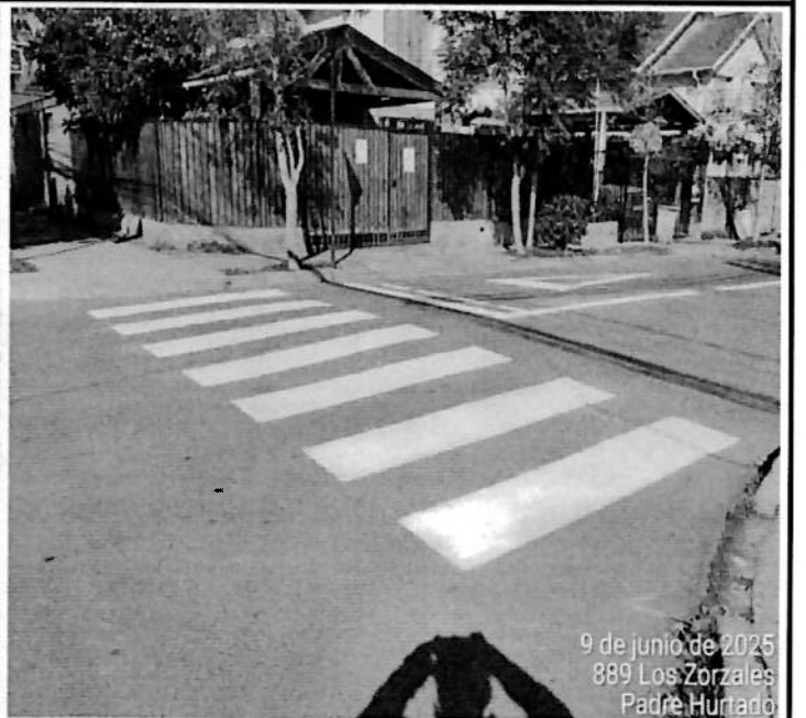
9 de junio de 2025 889 Los Zorzales Padre Hurtado