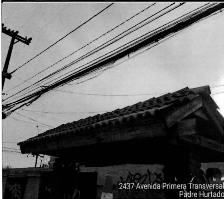
2437 Avenida Primera Transversal Padre Hurtado