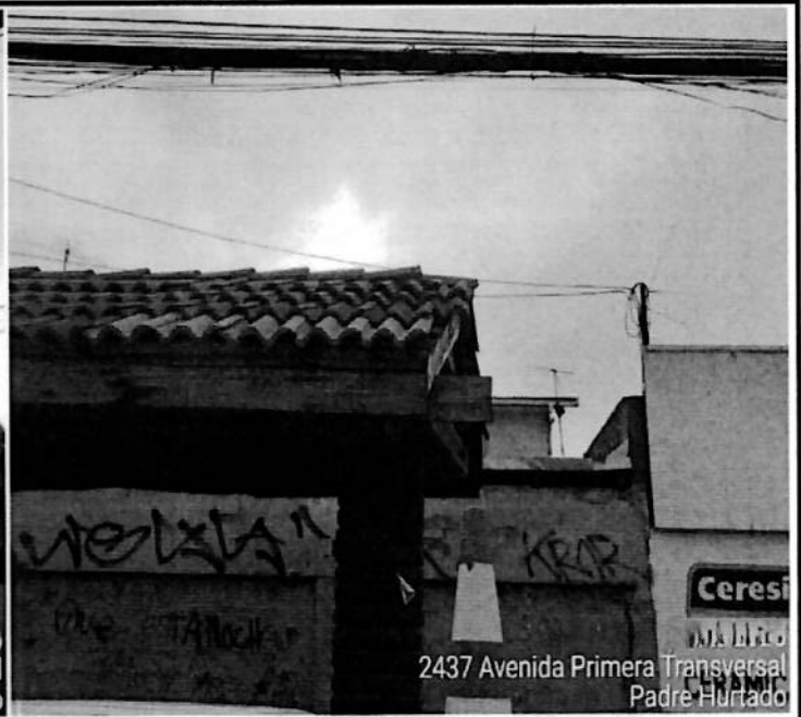
2437 Avenida Primera Transversal Padre Hurtado