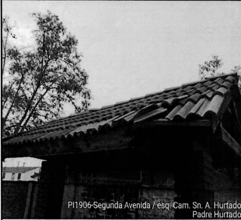
PI1906-Segunda Avenida / esq. Cam. Sn. A. Hurtado Padre Hurtado