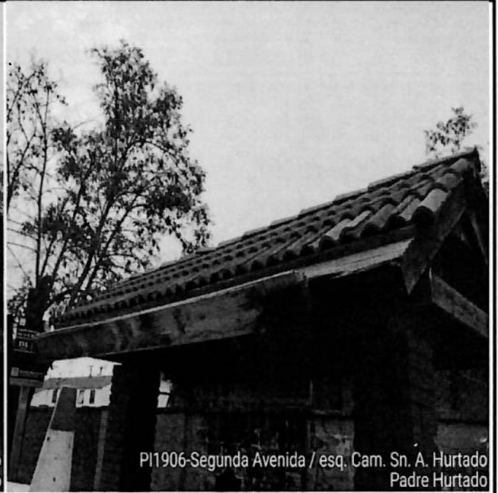
PI1906-Segunda Avenida / esq. Cam. Sn. A. Hurtado Padre Hurtado