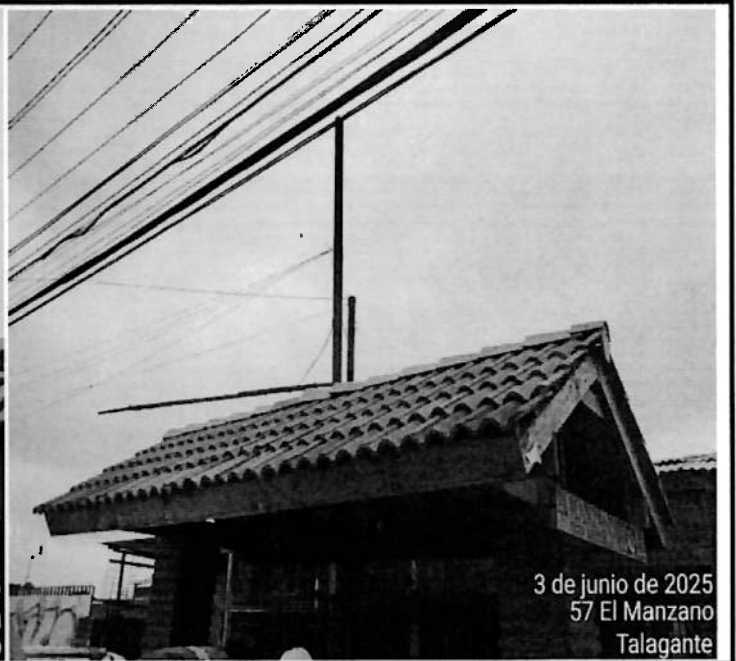
3 de junio de 2025 57 El Manzano Talagante