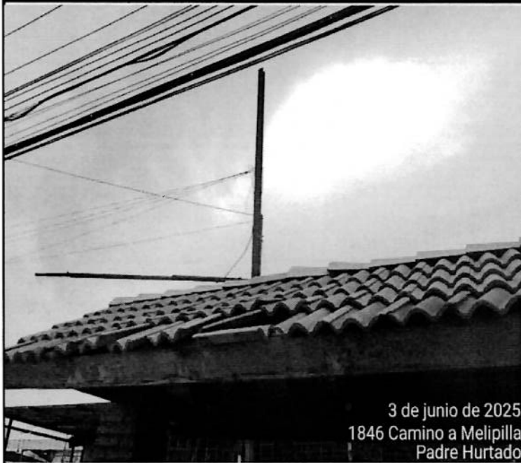
3 de junio de 2025 1846 Camino a Melipilla Padre Hurtado