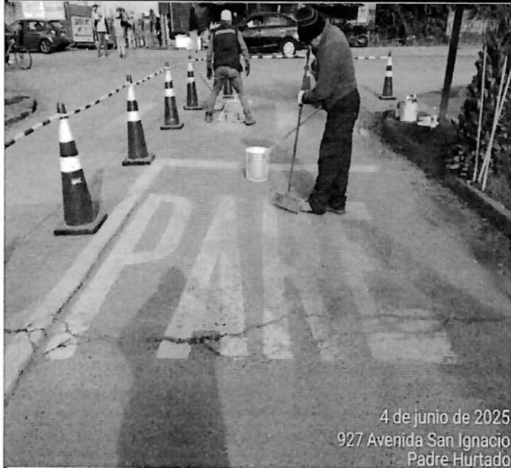
4 de junio de 2025 927 Avenida San Ignacio Padre Hurtado