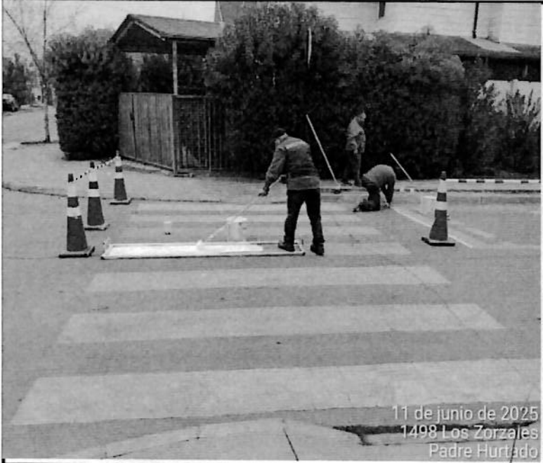
11 de junio de 2025 1498 Los Zorzales Padre Hurtado