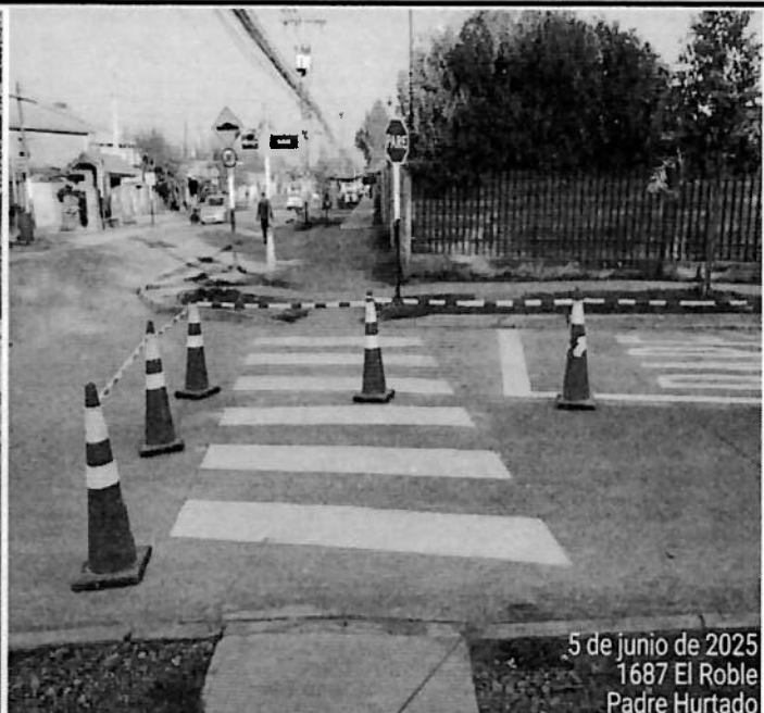
5 de junio de 2025 1687 El Roble Padre Hurtado