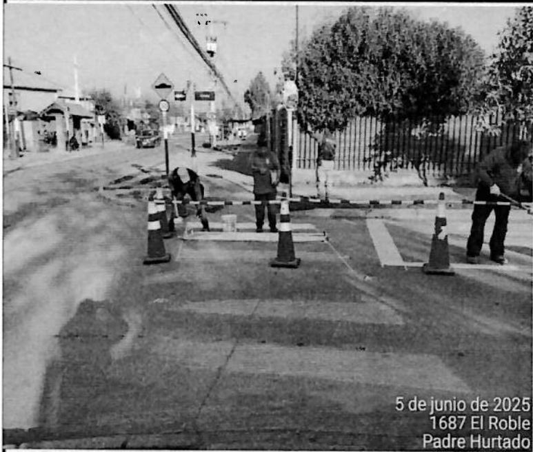
5 de junio de 2025 1687 El Roble Padre Hurtado