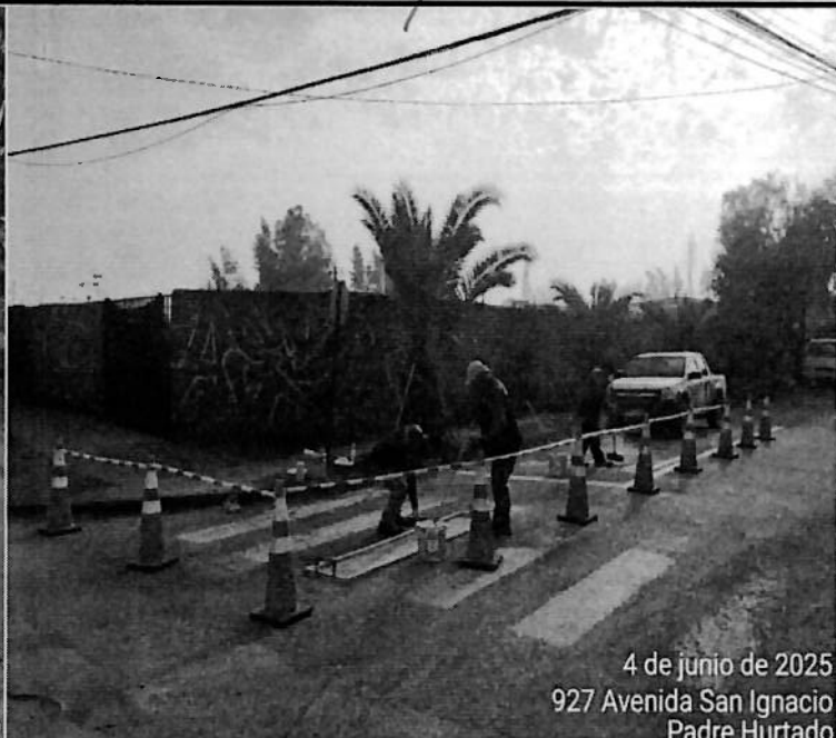
4 de junio de 2025 927 Avenida San Ignacio Padre Hurtado