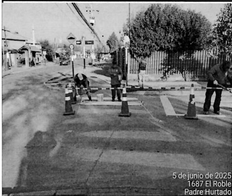
5 de junio de 2025 1687 El Roble Padre Hurtado