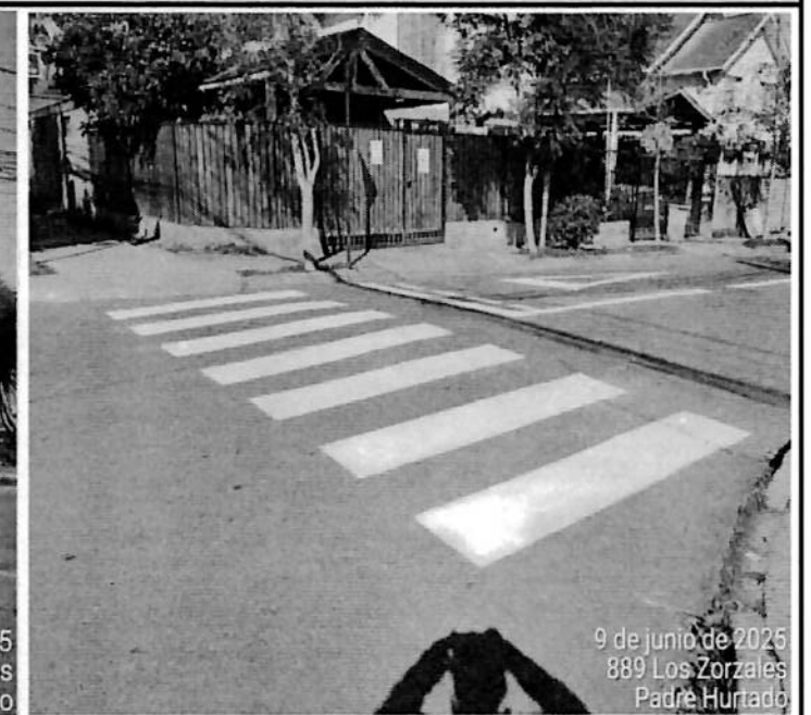
9 de junio de 2025 889 Los Zorzales Padre Hurtado