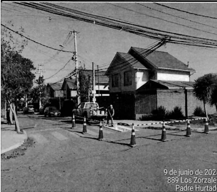
9 de junio de 2025 889 Los Zorzales Padre Hurtado