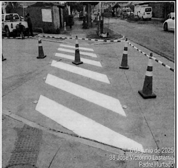
6 de junio de 2025 38 José Victorino Lastarria Padre Hurtado