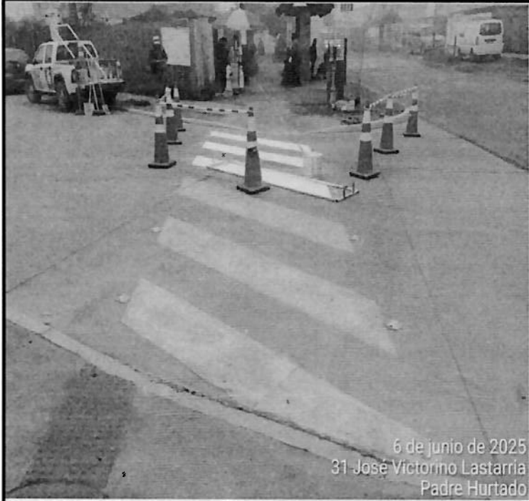
6 de junio de 2025 31 José Victorino Lastarria Padre Hurtado