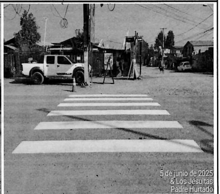
5 de junio de 2025 & Los Jesuitas Padre Hurtado