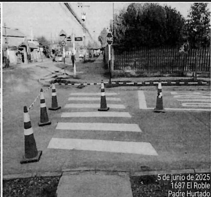
5 de junio de 2025 1687 El Roble Padre Hurtado