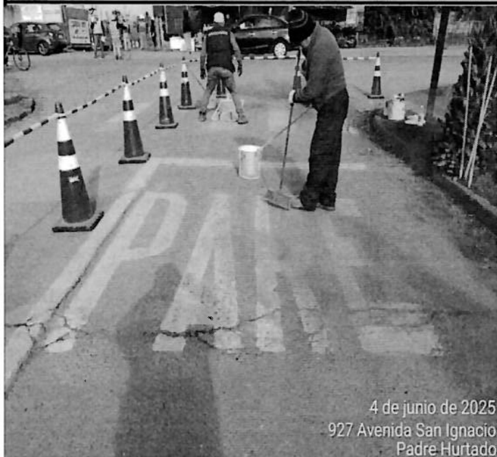
4 de junio de 2025 927 Avenida San Ignacio Padre Hurtado