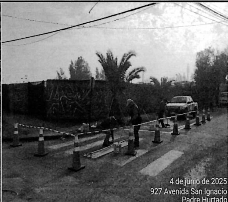
4 de junio de 2025 927 Avenida San Ignacio Padre Hurtado