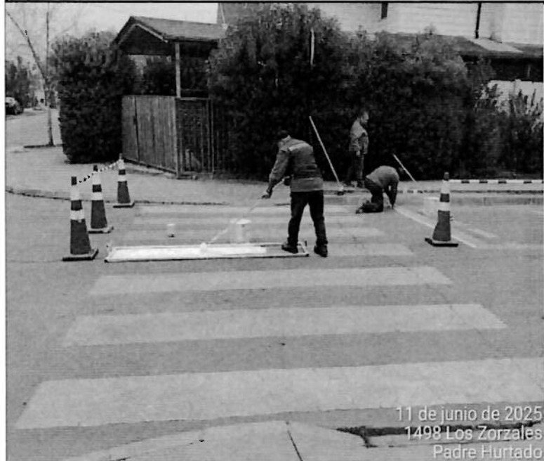
11 de junio de 2025 1498 Los Zorzales Padre Hurtado