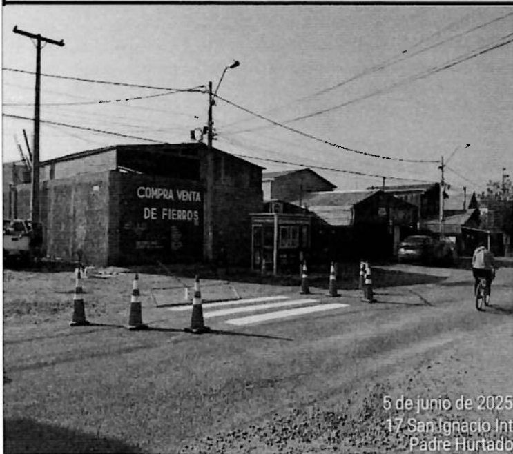
5 de junio de 2025 17 San Ignacio Int Padre Hurtado