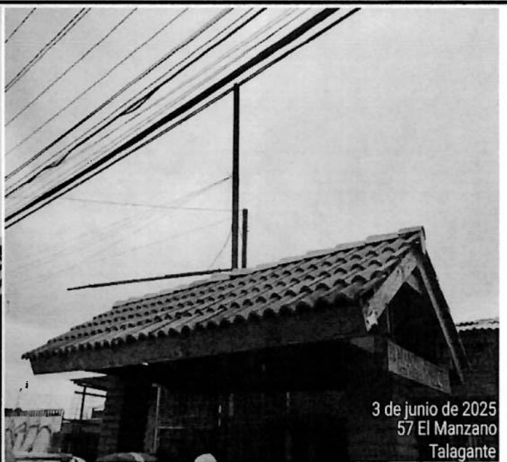
3 de junio de 2025 57 El Manzano Talagante