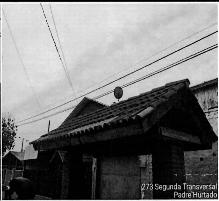
273 Segunda Transversal Padre Hurtado