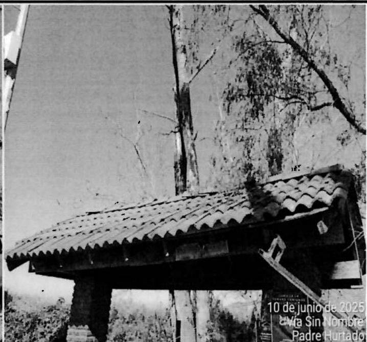
10 de junio de 2025 C/ta Sin Nombre Padre Hurtado