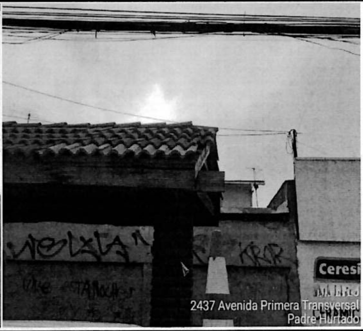
2437 Avenida Primera Transversal Padre Hurtado