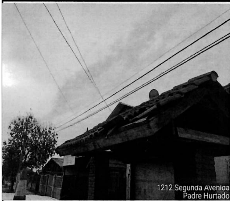
1212 Segunda Avenida Padre Hurtado