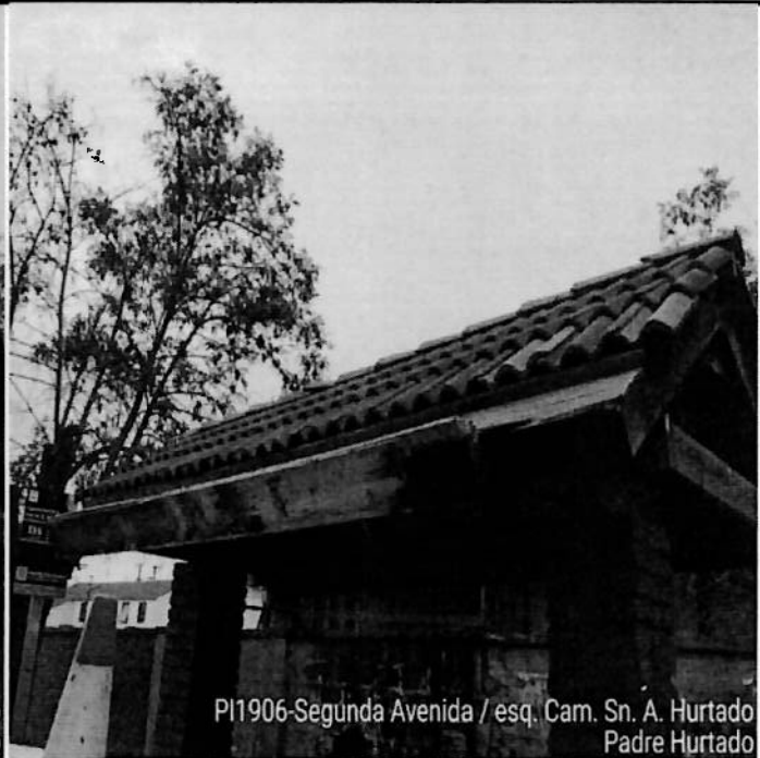
PI1906-Segunda Avenida / esq. Cam. Sn. A. Hurtado Padre Hurtado