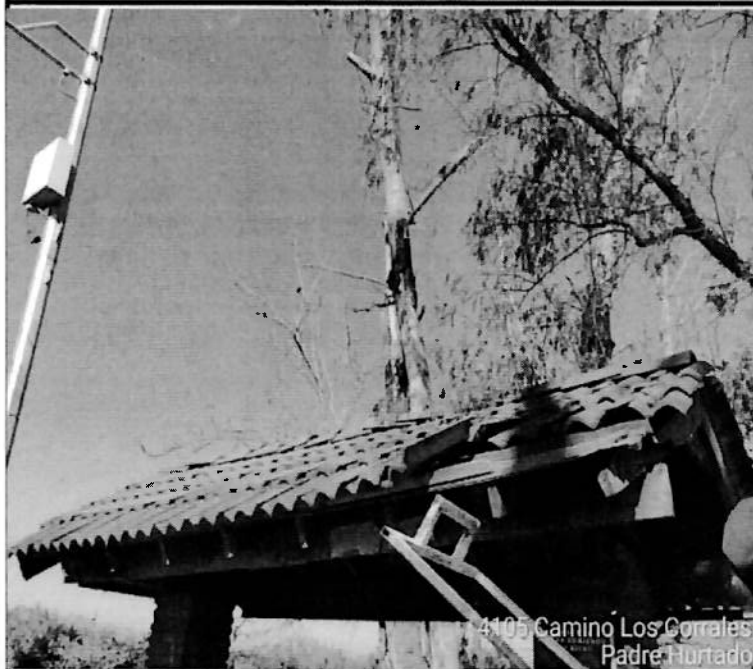
4105 Camino Los Corrales Padre Hurtado