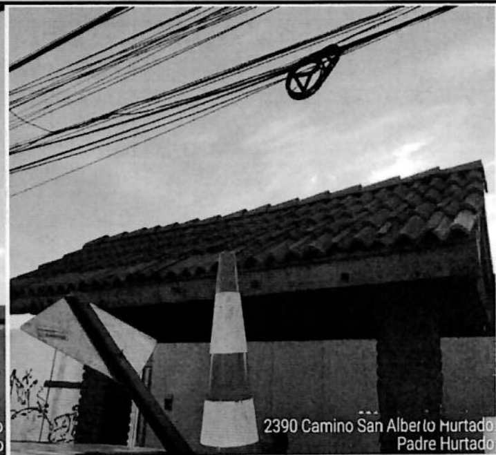
2390 Camino San Alberto Hurtado Padre Hurtado