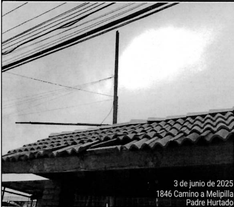
3 de junio de 2025 1846 Camino a Melipilla Padre Hurtado