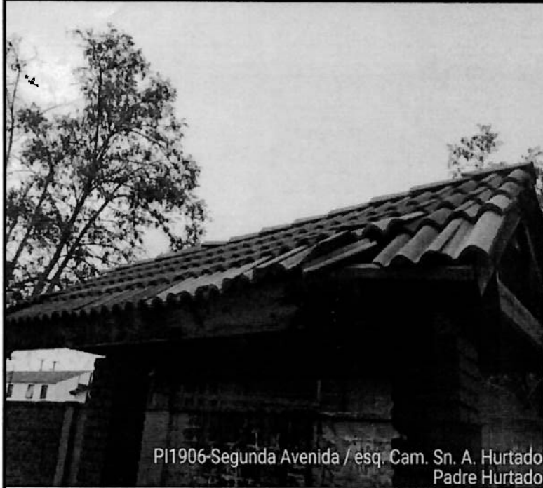
PI1906-Segunda Avenida / esq. Cam. Sn. A. Hurtado Padre Hurtado