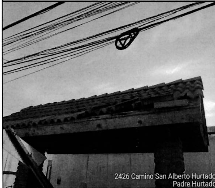
2426 Camino San Alberto Hurtado Padre Hurtado