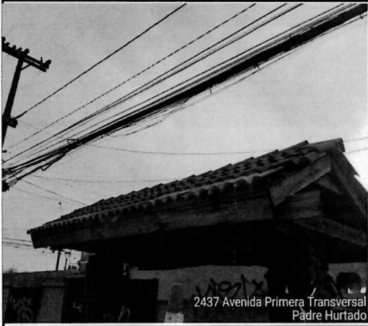
2437 Avenida Primera Transversal Padre Hurtado