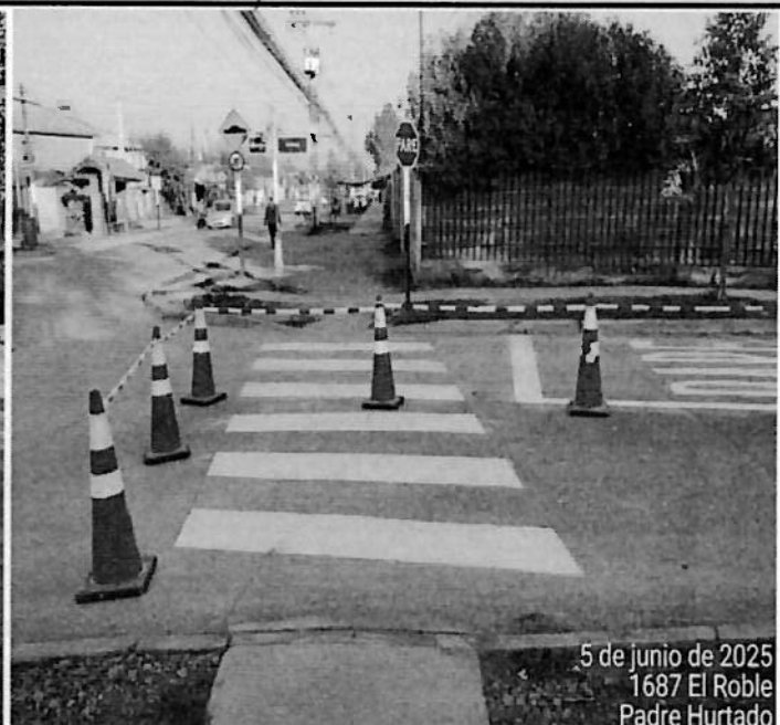
5 de junio de 2025 1687 El Roble Padre Hurtado