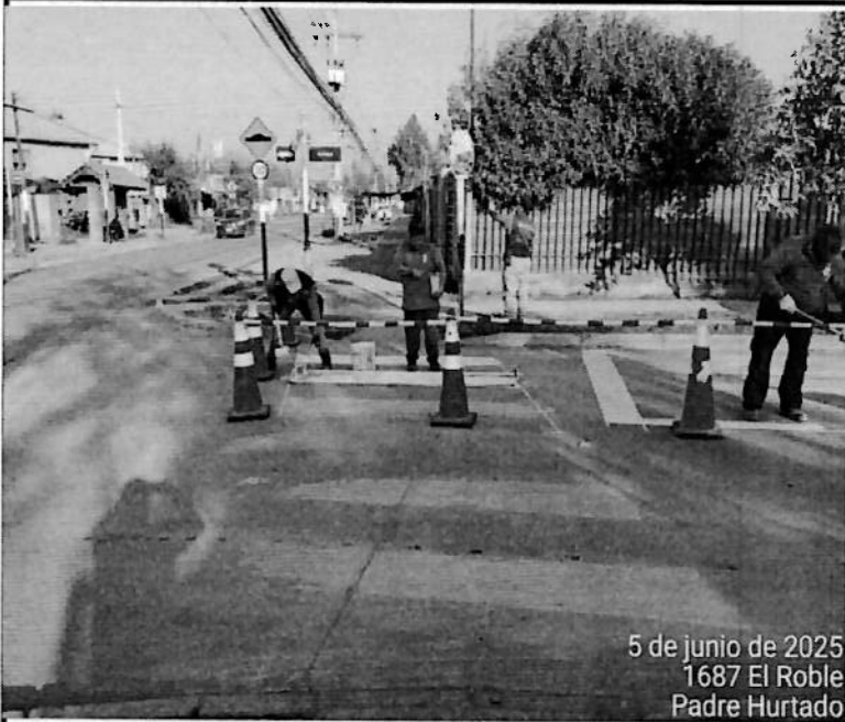
5 de junio de 2025 1687 El Roble Padre Hurtado