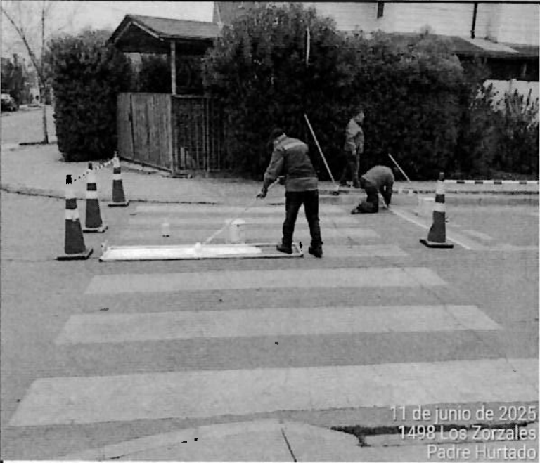
11 de junio de 2025 1498 Los Zorzales Padre Hurtado