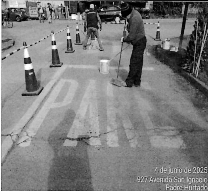
4 de junio de 2025 927 Avenida San Ignacio Padre Hurtado