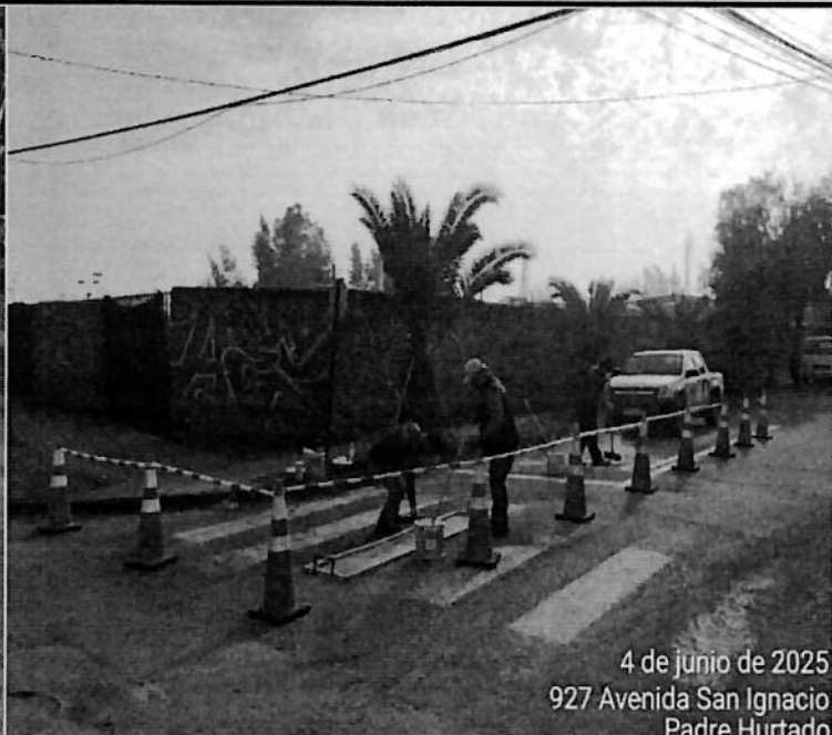
4 de junio de 2025 927 Avenida San Ignacio Padre Hurtado