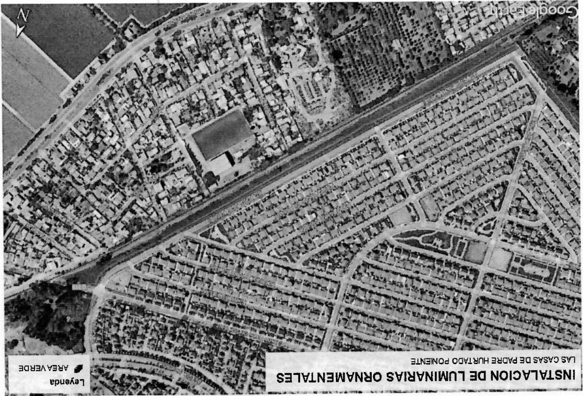
Area Verde Sector las Casas de Padre Hurtado Poniente