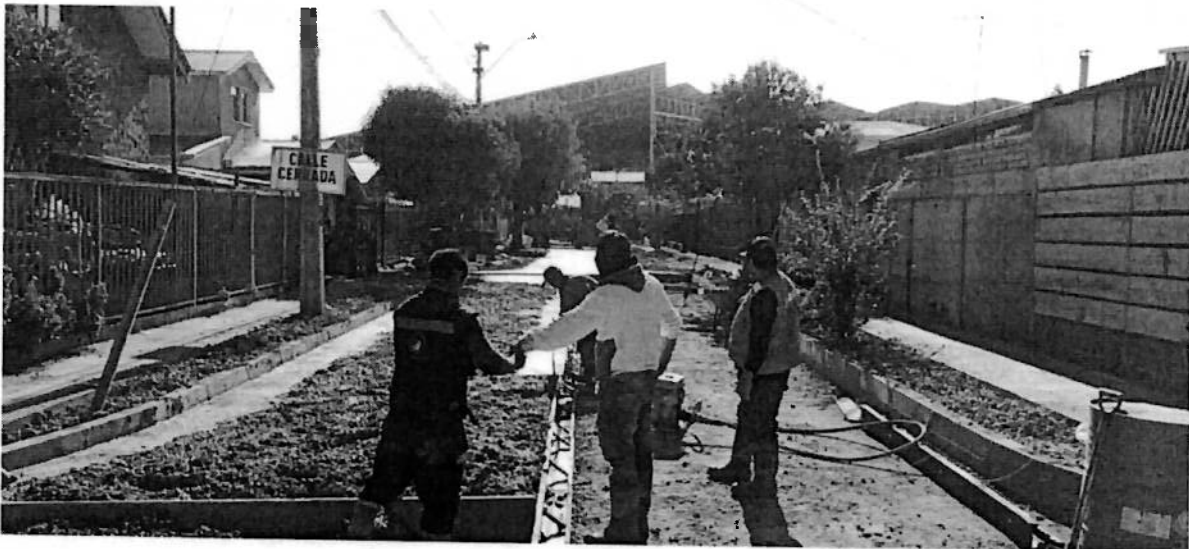
HORMIGONADO PASAJE EL LINGUE