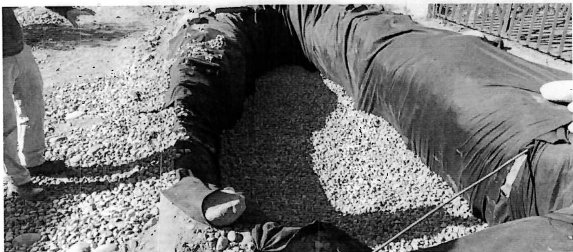
RELLENO DE DREN EL LINGUE