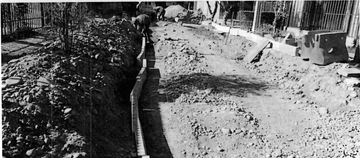
REINSTALACIÓN DE SOLERA PASAJE LAS ARAUCARIAS