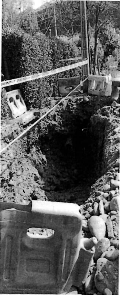
EXCAVACIÓN DREN LAS ARAUCARIAS