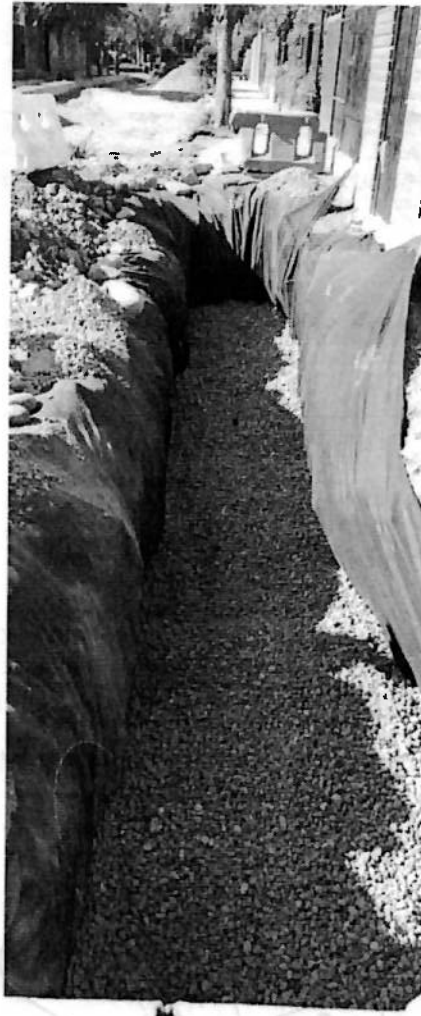
RELLENO DREN LOS CIPRESES