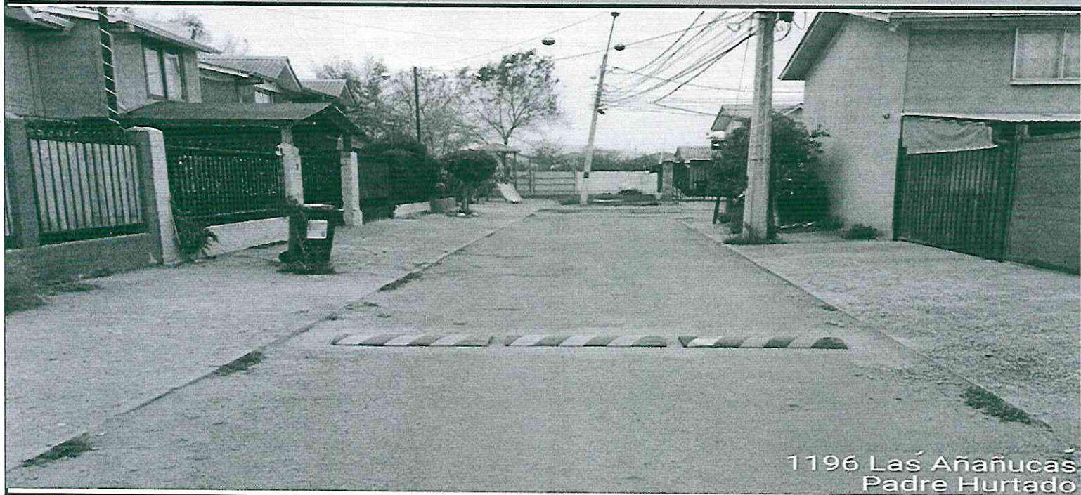
LAS AÑAÑUCAS FRENTE AL 1196