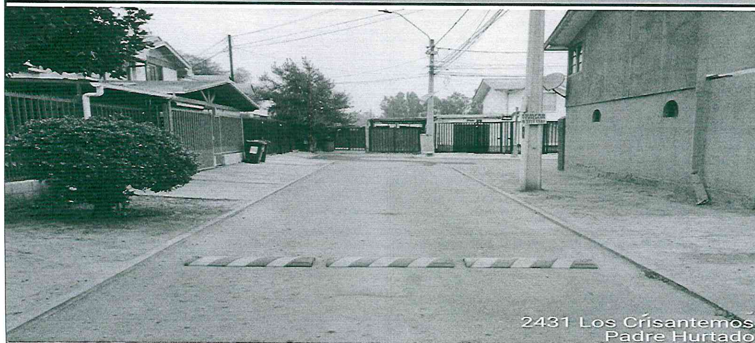
LOS CRISANTEMOS FRENTE AL 2431