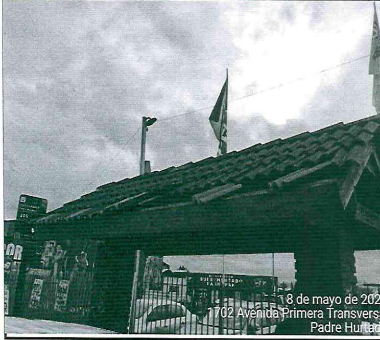
8 de mayo de 2025 1702 Avenida Primera Transversal Padre Hurtado