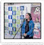
02-04-2025 Entrega de... 12 fotos | Editar

haz clic aquí para agregar una descripción