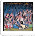
04-04-2025 Cuentacuentos en... 9 fotos | Editar