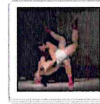
28-04-2025 Celebración día... 35 fotos | Editar

Informo que en el siguiente enlace pueden revisar el álbum completo de actividades del mes de abril de 2025