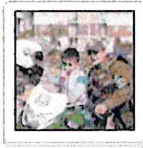
22-04-2025 Celebración mes... 38 fotos | Editar