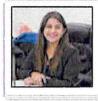
08-04-2025 Sesión N°11... 21 fotos | Editar