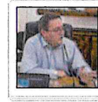
15-04-2025 Sesión concejo... 20 fotos | Editar