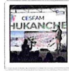
26-04-2025 Cuenta Pública 2024 108 fotos | Editar