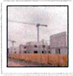
17-04-2025 Proyecto... 12 fotos | Editar