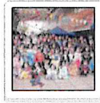
23-04-2025 Celebración día... 22 fotos | Editar