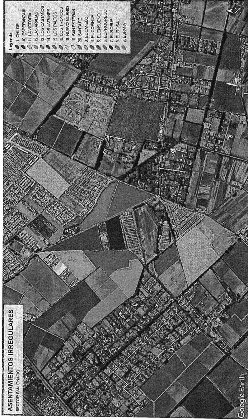
Plano de identificación de territorio que comprende el sector de San Ignacio