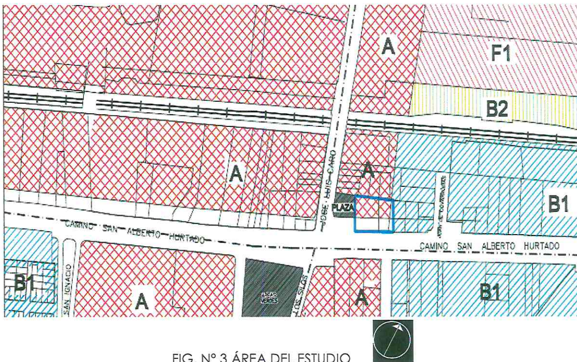
FIG. N° 3 ÁREA DEL ESTUDIO

(Corredor Mixto Regional), enfrentando el Camino San Alberto Hurtado (Ex Camino Melipilla) y Av. José Luis Caro (Ex Camino a Valparaíso); establecidos en plano N° PRCPH-01 de Zonificación y la Ordenanza del Plan Regulador Comunal de Padre Hurtado del año 2005. Dichas zonas están contenidas en Capítulo 4 de la presente Memoria, sobre Zonificación, Usos de Suelo y Normas Específicas de la citada Ordenanza Local.