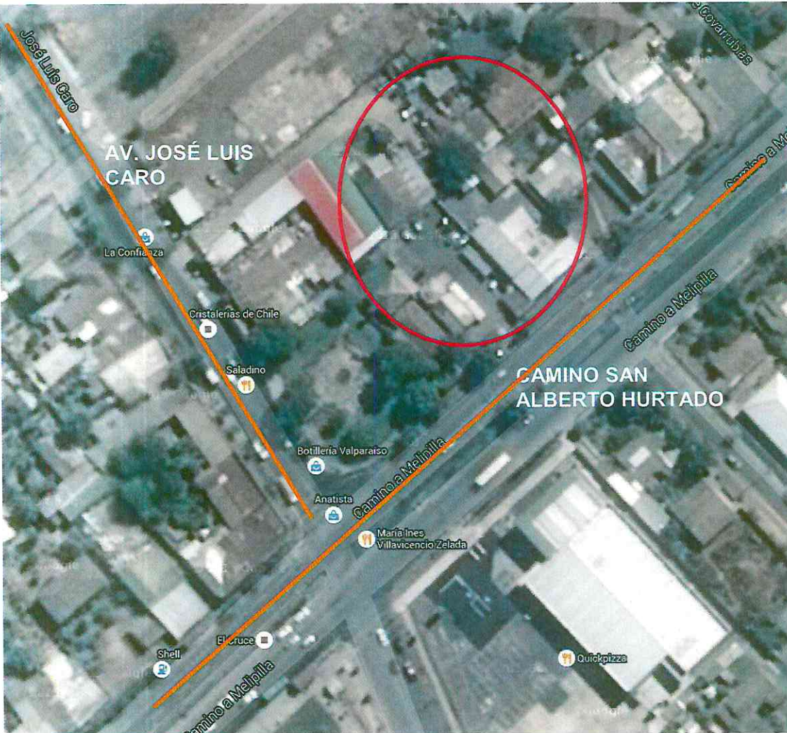
FIG. N°2 SECTOR DE EMPLAZAMIENTO DEL ÁREA INVOLUCRADA.