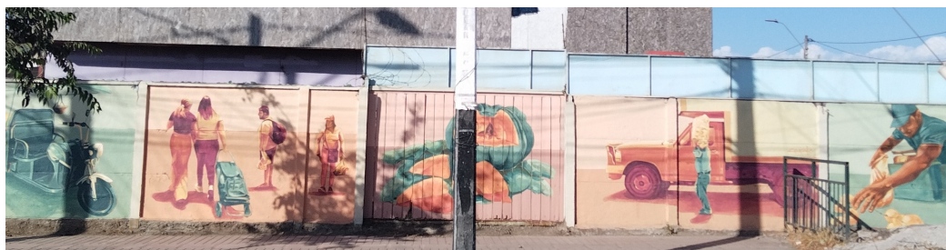
Mural retratado en Los Silos, en el que se representa el rol de la feria en la villa. Artista: Cardo.

El proyecto Dale color a villa Río Aconcagua busca crear un recorrido, en que se aprecien diversos murales que representen la historia e identidad de este territorio. En diciembre, avanzamos cuatro nuevos murales.