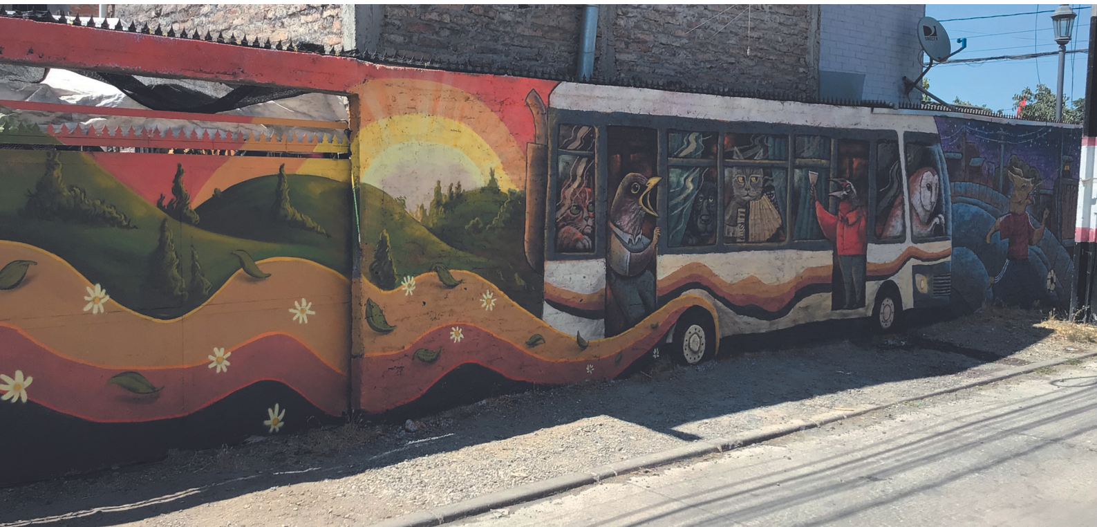
En diciembre, se desarrollaron cuatro murales más en el barrio. Estos representan parte de la historia e identidad de la villa Río Aconcagua

Programa de Recuperación de Barrios en la Villa Río Aconcagua