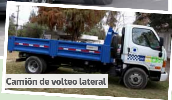
Camión de volteo lateral

mejor servicio a nuestros vecinos, sobretodo en la limpieza que a diario necesita la comuna.